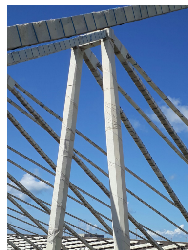
Viste degli stralli